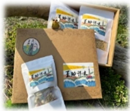
有構讚禮盒(彰化縣王功蚵藝文化協會)