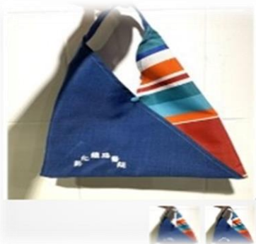
三角巾包(有限責任彰化縣大愛照顧服務勞動合作社)