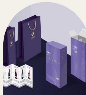
禮盒及提袋主視覺一致 整體質感提升