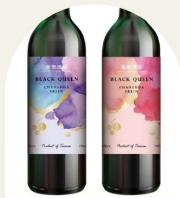
酒標以"花"為靈感 將葡萄色澤與花融合