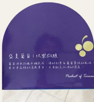
以紫色代表原料葡萄 跳脫紅酒禮盒傳統樣貌